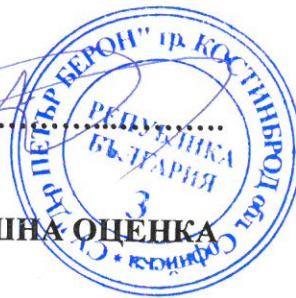
ГРАФИК ЗА ПРОВЕЖДАНЕ НА ИЗПИТИТЕ ЗА ОПРЕДЕЛЯНЕ НА ГОДИШНА ОЦЕНКА ЗА УЧЕНИЦИ ПОД 16-ГОДИШНА ВЪЗРАСТ В САМОСТОЯТЕЛНА ФОРМА НА ОБУЧЕНИЕ – трета сесия